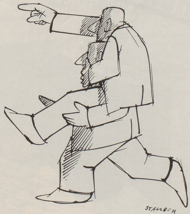
Zeichnungen: Jules Stauber