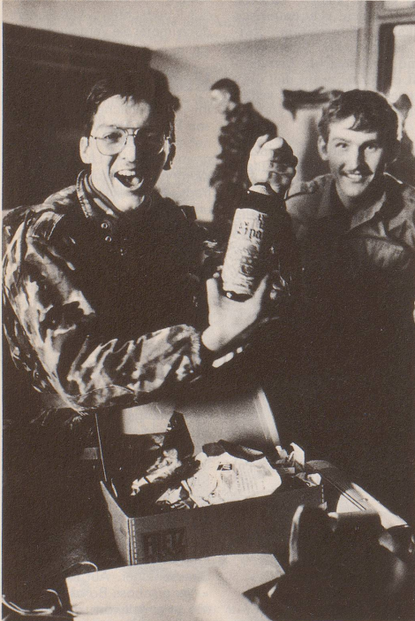
4 Denn RS bedeutet anderes: Umgang mit der Waffe, ...