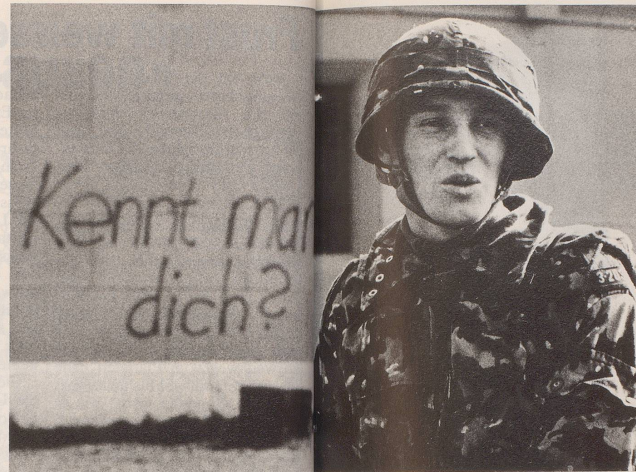
2 ... kritische Fragen verfällt, sollte Besuch einer RS absehen, ...