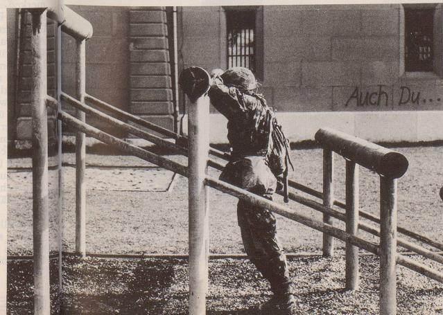
6 ... und Umgang mit deren Einfallsreichtum.