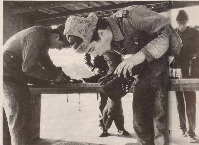
5 ... Umgang mit den Vorgesetzten ...