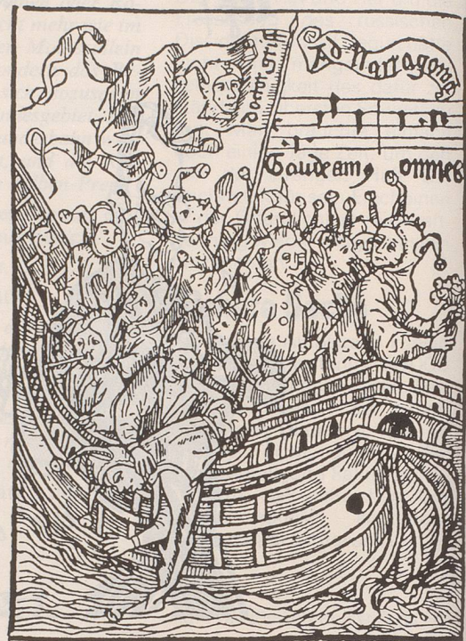
Albrecht Dürer «Das Narrenschiff», 1497