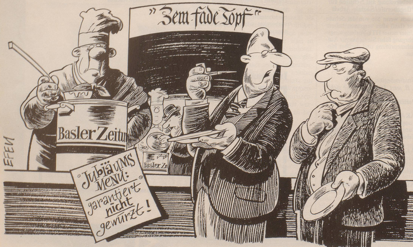
«Wenn ich nicht darauf angewiesen wäre, wäre ich schon längst in den Hungerstreik getreten!»

Während der Mustermesse 87 soll den Baslern Trost widerfahren. Ringier plant, während der Messe täglich eine Zeitung für Basel herzustellen. Dafür wird an der Muba eine komplette Zeitungsdruckerei aufgebaut und eigens eine Redaktion eingesetzt.