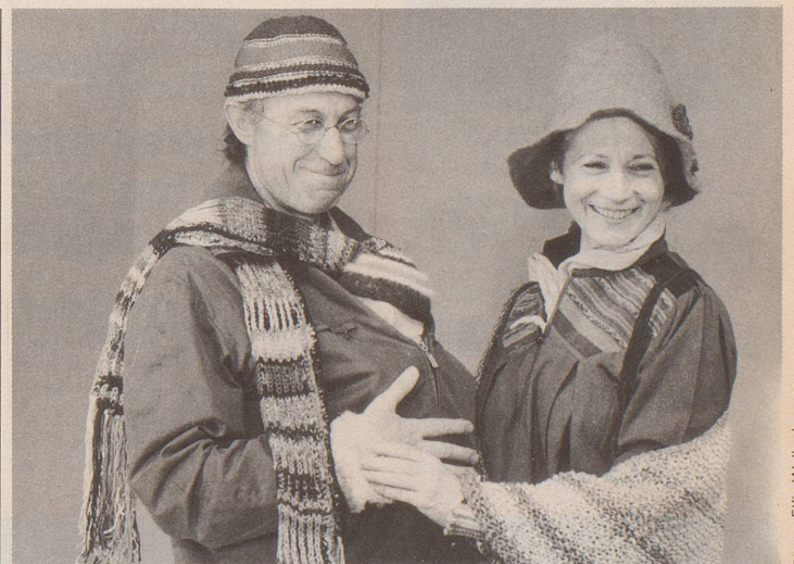
Der alternative Er, auf dem Weg zum Reformhaus, trifft zufällig auf die alternative Sie, die gerade aus dem Sensitivity-Training kommt.

Das «Opus 12» wurde für eine Zeit geschrieben, die – in Anlehnung an Tucholsky – nach Satire schreie, «aber auch», so César Keiser zu seinem 17. geistigen Kind, «nach vielem anderem: