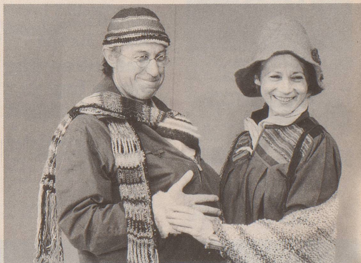
Der alternative Er, auf dem Weg zum Reformhaus, trifft zufällig auf die alternative Sie, die gerade aus dem Sensitivity-Training kommt.

D as «Opus 12» wurde für eine Zeit geschrieben, die – in Anlehnung an Tucholsky – nach Satire schreie, «aber auch», so César Keiser zu seinem 17. geistigen Kind, «nach vielem anderem: