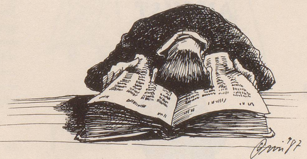
Illustration: OSSI MÖHR

mittlerweile auch schon, vor lauter Eifer und Ungeduld. Was sollte das nun wieder? Wollte ihn jemand auf den Arm nehmen? Was war ein «Fugen-s»? Er hatte noch nie davon gehört, dass man zum Glück ein «Fugen-s» benötigen würde. Seine Verwirrung wuchs. Es blieb ihm nur noch der Duden Nr. 1. Zwischen Gluckhenne und Glucose stand: