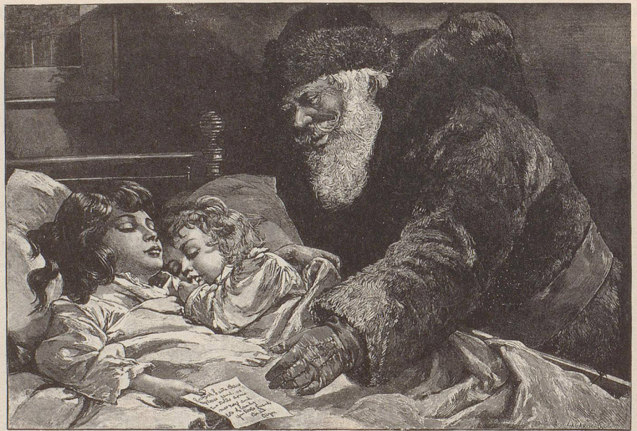
Recht wild ging es an «Merry Christmas» im alten England um 1865 zu. Da wurde getanzt und geflirtet, gescherzt und geküsst, geschlemmt und getrunken. Über allem thronte der mit einem Stechpalmen-Ehrenkranz geschmückte, eifrig mitbechernde Santa Claus, der das Weihnachtstreiben in England und den Vereinigten Staaten beherrschte.