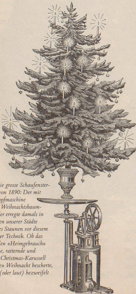
Das war die grosse Schaufenstersensation von 1890: Der mit einer Dampfmaschine betriebene Weihnachtsbaum-Drehständer erregte damals in den Strassen unserer Städte andächtiges Staunen vor diesem Wunder der Technik. Ob das auch für den «Heimgebrauch» empfohlene, ratternde und zischende Christmas-Karussell eine «stille» Weihnacht bescherte, darf leise (oder laut) bezweifelt werden.

Es wäre schön, wenn unsere kleine Helgenpost auch Sie zu einem – trotz allem – zukunftsfrohen Schmunzeln ermuntern könnte.