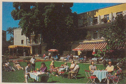
Kurhotel Habsburg, Gartenrestaurant