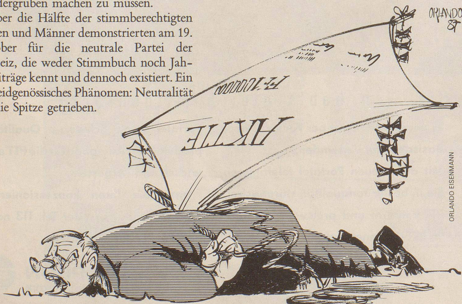
Tiefflieger am Aktienmarkt