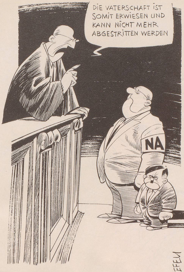
Das Bundesgericht hat festgehalten: Die Nationale Aktion (NA) darf als «nazihft rassistisch» bezeichnet werden.