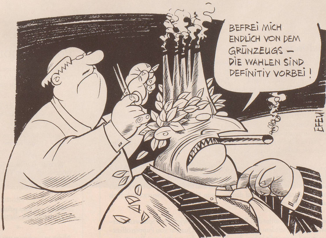
Montag, 19. Oktober 1987, der erste Tag nach der Wahl.