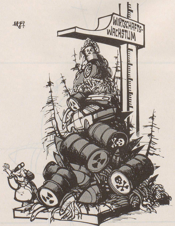
«Hurra, wieder 2,5% höher!»