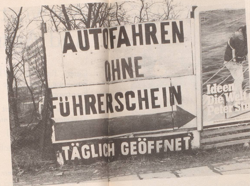
1 Mit vorbildlichem Elan («Freie Fahrt für freie Bürger») ...