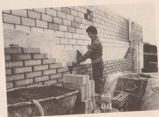
3 Jetzt kommt die Hüsli-Partei («Jedem Schweizer sein Einfamilienhaus»).