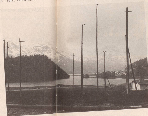
4 Bauland haben wir ja mehr als genug!