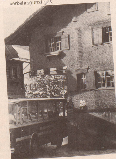
8 Frisch, frank, fröhlich, frei mit Auto- und Hüslipartei!