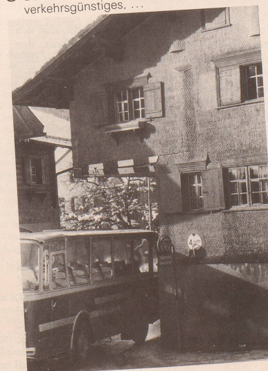
8 Frisch, frank, fröhlich, frei mit Auto- und Hüslipartei!