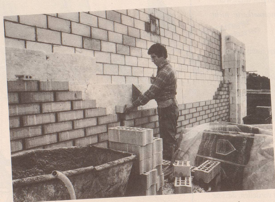
3 Jetzt kommt die Hüsli-Partei («Jedem Schweizer sein Einfamilienhaus»).