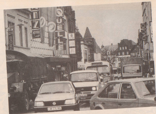
2 ... ist die Autopartei an den Wahlstart gesprintet.