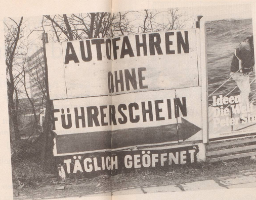
1 Mit vorbildlichem Elan («Freie Fahrt für freie Bürger») ...