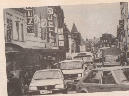
2 ... ist die Autopartei an den Wahlstart gesprinet.