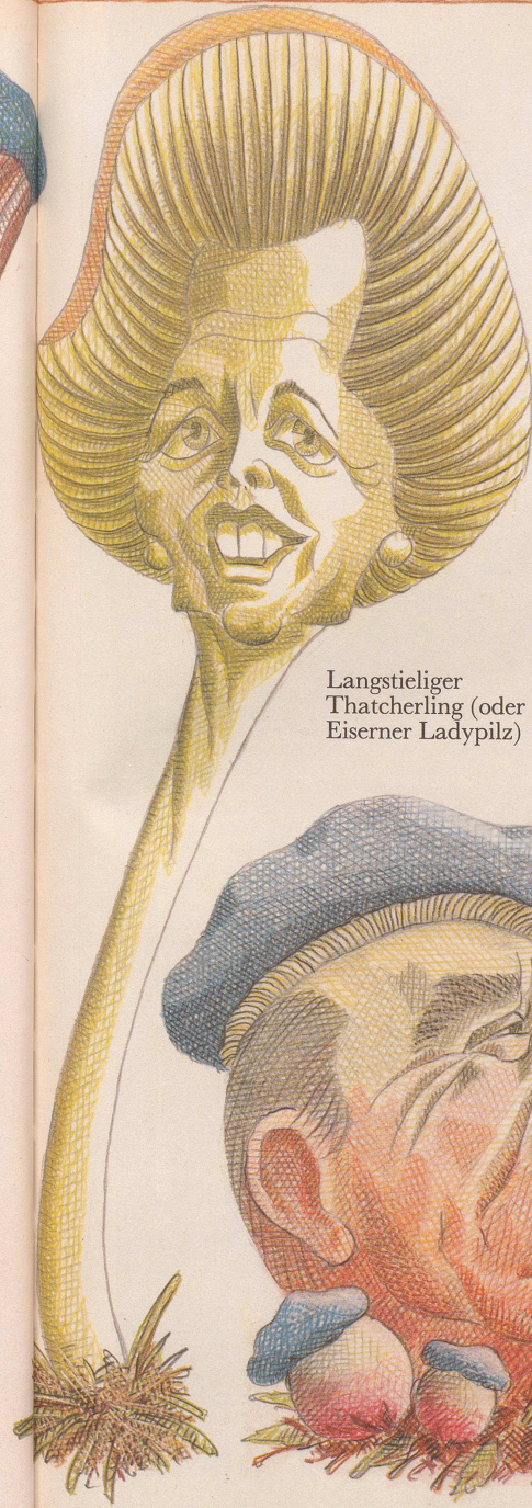
Langstieliger Thatcherling (oder Eiserner Ladypilz)