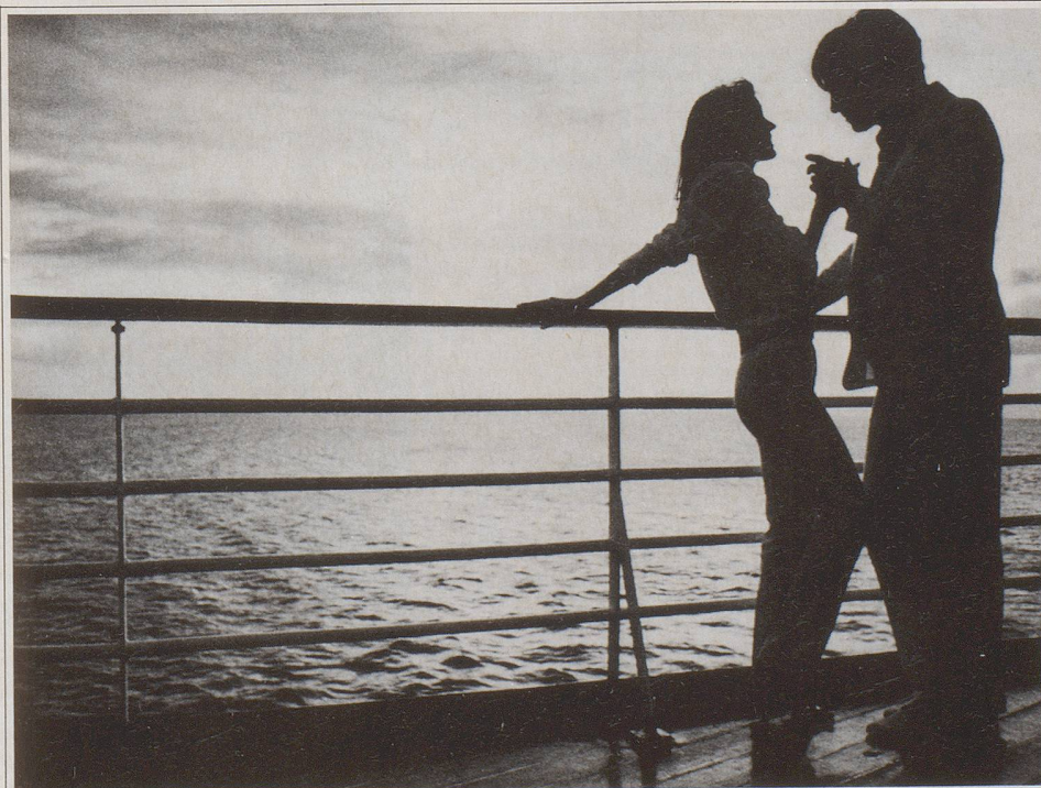
Lintas RCCL 187

Karibik. Abend auf der «Song of America». Nach dem «Captain's Dinner» geniessen wir die frische Brise auf dem Achterdeck. «Gibt's hier eigentlich noch Piraten?» fragt sie. «Keinen ausser mir», sage ich und fletsche die Zähne. Sie lacht und begleitet mich zurück in den Salon, wo gleich die Show beginnt. Möchten Sie nicht einmal die Karibik so erleben? Mit uns, der Kreuzfahrtgesellschaft Nr. 1. Unser Prospekt gibt Ihnen einen Vorgeschmack.