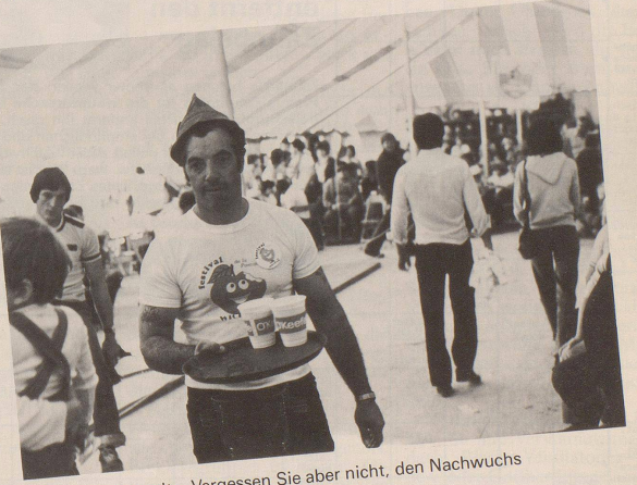
8 ... der Bierzelte. Vergessen Sie aber nicht, den Nachwuchs rechtzeitig ...