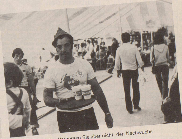
8 ... der Bierzelte. Vergessen Sie aber nicht, den Nachwuchs rechtzeitig ...