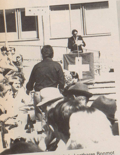
5 ... auf dass euch kein kostbares Bonmot entgehe.