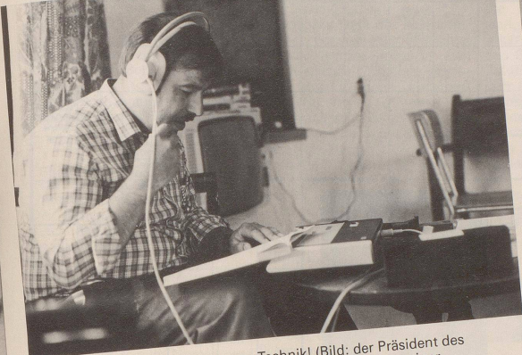
3 Festredner, nutzt die moderne Technik! (Bild: der Präsident des Niederlaufhunde-Vereins Oberbipp beim Vorbereiten seiner Standortbestimmung)