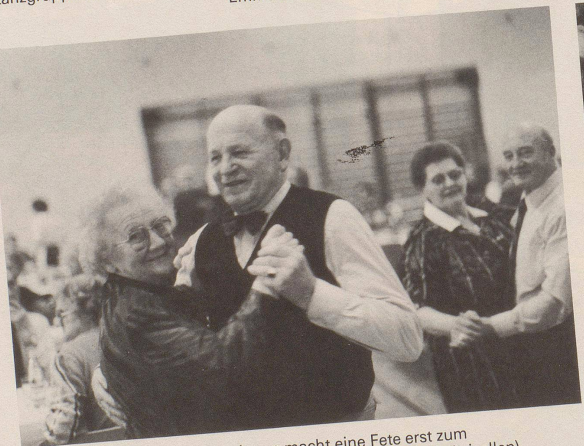
6 Das Mischen der Generationen macht eine Fete erst zum Genuss. (Bild: Nostalgieabend im Jugendhaus von Brüttisellen)