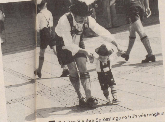
7 Geleiten Sie Ihre Sprösslinge so früh wie möglich in die faszinierende Welt ...