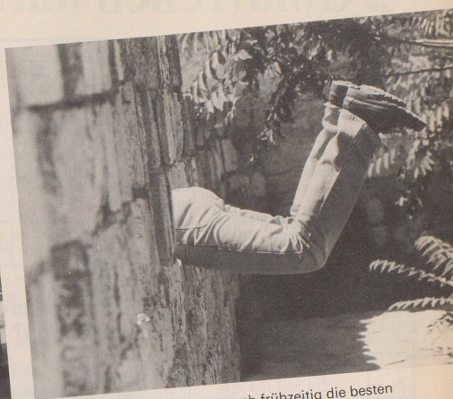
4 Festbesucher, reserviert euch frühzeitig die besten Plätze, ...