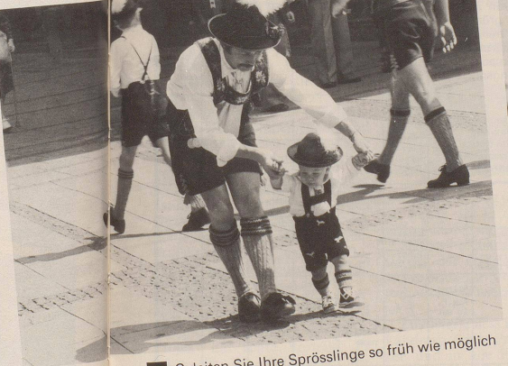
7 Geleiten Sie Ihre Sprösslinge so früh wie möglich in die faszinierende Welt ...