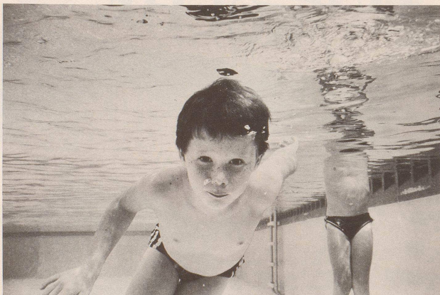
«Meinem Bruder steht das Wasser bis zum Hals.»