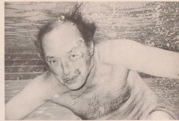
«Könnte ich jetzt wohl meine Sauerstoffflasche zurückhaben?»