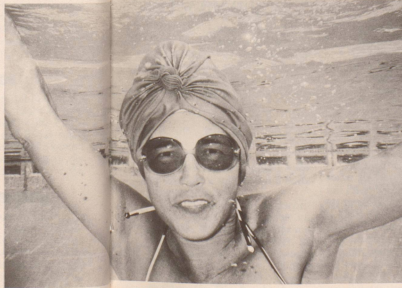
«Und Sie, wo haben Sie Ihre Badekappe?»