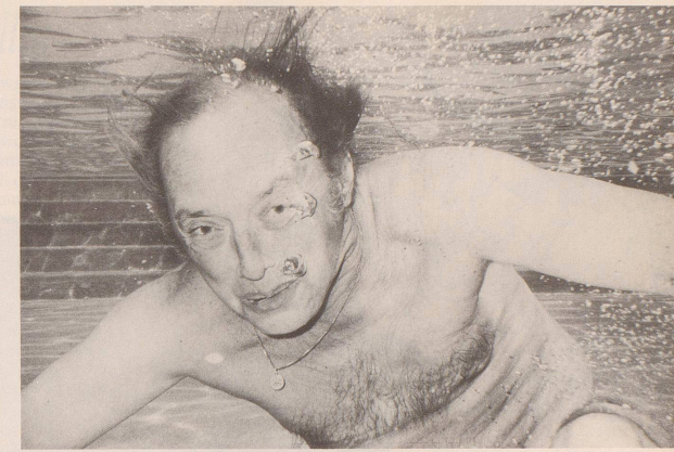
«Könnte ich jetzt wohl meine Sauerstoffflasche zurückhaben?»