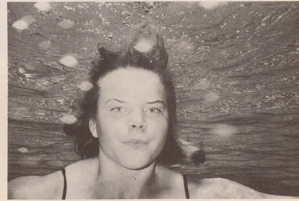
«Mir läuft das Wasser im Mund zusammen.»