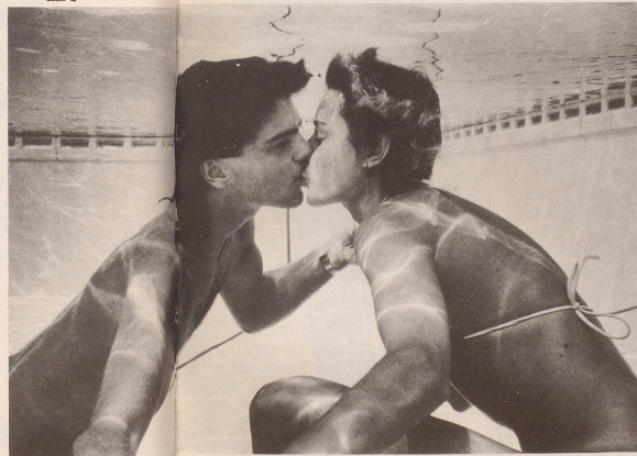
«Immer deine nassen Küsse ...»