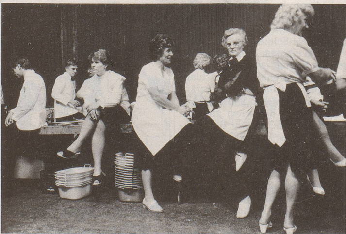
... und hinter der Kulisse. (Aus der Serie Szenen aus der Schweiz )

Offiziere am Ball, Gewerkschafter/-innen am Kongress, Männer im Nachtclub, Flüchtlinge in ihren Baracken, Jugendliche in der Schule, Aktionäre an der GV, krebserkrankte Kinder im Alltag, Männer in der Rekrutenschule, Arbeiter im Atomkraftwerk und der Tod. Michael v. Graffenried, geboren 1957, lebt in Bern. Er ist freier Photograph für Zeitungen, Zeitschriften und Magazine im In- und Ausland, regelmässiger Mitarbeiter des Nebelspalter s (Titelbild der vorliegenden Nummer), Autor verschiedener Bildbände. Letzte Veröffentlichung Bundeshaus-Fotografien (Grafino, Bern 1985).