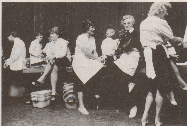
... und hinter der Kulisse. (Aus der Serie Szenen aus der Schweiz )

Offiziere am Ball, Gewerkschafter/-innen am Kongress, Männer im Nachtclub, Flüchtlinge in ihren Baracken, Jugendliche in der Schule, Aktionäre an der GV, krebserkrankte Kinder im Alltag, Männer in der Rekrutenschule, Arbeiter im Atomkraftwerk und der Tod. Michael v. Graffenried, geboren 1957, lebt in Bern. Er ist freier Photograph für Zeitungen, Zeitschriften und Magazine im In- und Ausland, regelmässiger Mitarbeiter des Nebelspalters (Titelbild der vorliegenden Nummer), Autor verschiedener Bildbände. Letzte Veröffentlichung Bundeshaus-Fotografien (Grafino, Bern 1985).