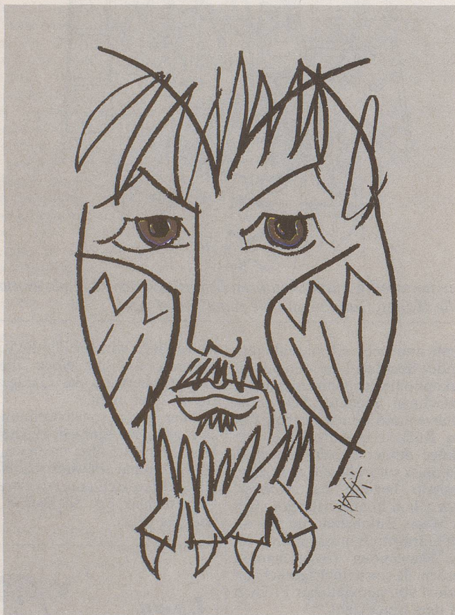
Celestino Piatti: Selbstporträt als Eule, 1982

Der Graphiker Celestino Piatti ist unsern Lesern durch die Gestaltung vieler Nebelspalter -Titelblätter bekannt. Das neueste erschien mit Nr. 51/52 zu Weihnachten 1986. Die Arbeiten Piattis begegnen uns aber auch anderswo und hier fast auf Schritt und Tritt: Im Lauf der letzten 40 Jahre gestaltete der Künstler über 400 Plakate, seit 1960 auch das künstlerische und typographische Erscheinungsbild des Deutschen Taschenbuch-Verlags. Für das breite Publikum wahrnehmbar ist dies vor allem anhand der bereits über 5000 dtv-Buchumschläge, deren Graphik im Atelier Celestino Piatti entstanden ist. Der Künstler trat auch hervor als Illustrator von Texten, als Zeichner von Kinderbüchern, aber auch als freier Maler und Lithograph. Als Hommage zu seinem 65. Geburtstag am 5. Januar publizierte der dtv-Verlag ein Taschenbuch mit dem Titel Celestino Piatti – Meister des graphischen Sinnbilds , das Piattis umfangreiches Schaffen in gut ausgewählten Beispielen würdigt.