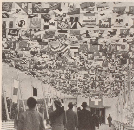
Sie begann im Frieden und endete im Krieg: Die Landi 1939 dauerte vom 6. Mai bis zum 29. Oktober. Auf der Höhenstrasse flatterten die Wimpel von rund 3000 Schweizer Gemeinden. Vor der Landesausstellung hatten die Heraldiker Höchstkonjunktur: Wer damals nämlich noch kein eigenes Gemeindegewapp hatte, liess sich stugs eines entwerfen, um ja bei der grossen Flaggenparade nicht zu fehlen. Deshalb datieren die Embleme von Dutzenden von Schweizer Gemeinden just aus diesem Landi-Jahr 1939.

Falls jedoch Sie Lust auf eine eigene Landes hymne haben, greifen Sie ungeniert zu Klavier und Schreibmaschine, respektive zu Synthesizer und Computer und dichten und komponieren Sie munter drauflos. Wer weiss, vielleicht singt man dann zur Jahrtausendwende Ihr Schweizerlied?