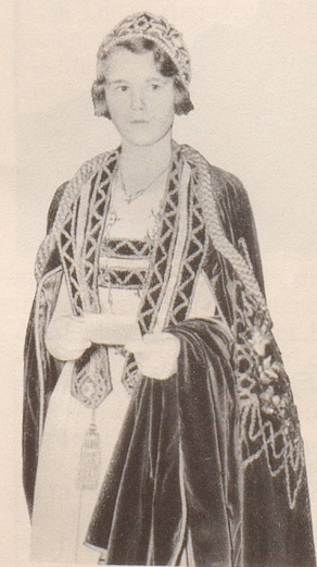
Wenigstens eine Königin besuchte die Schweizerische Landesausstellung 1939: Die englische «Eisenbahnkönigin». Ihr zu Ehren wurde an ihrem Bankett die Vorsepe mit einer Spielzeug-Eisenbahn über den Tisch gerollt.