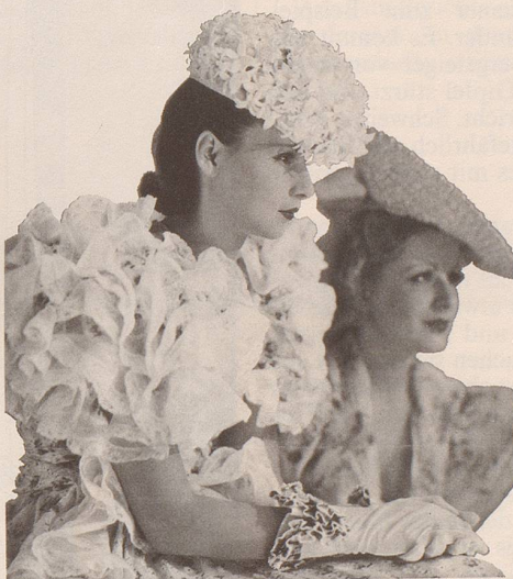
Das Landi-Modetheater zeigte eine elegante Revue: «Der verlorene Faden». Hunderte von schönen Schweizer Mädchen meldeten sich, um bei dieser exquisiten Mannequinstuppe dabei sein zu dürfen. Das eleganteste Dutzend schaffte es. Hier sehen wir zwei dieser Landi-Sterne. Sie führten die Schöpfungen unserer Textilindustrie auch mit rassistigen Tanznummern vor.