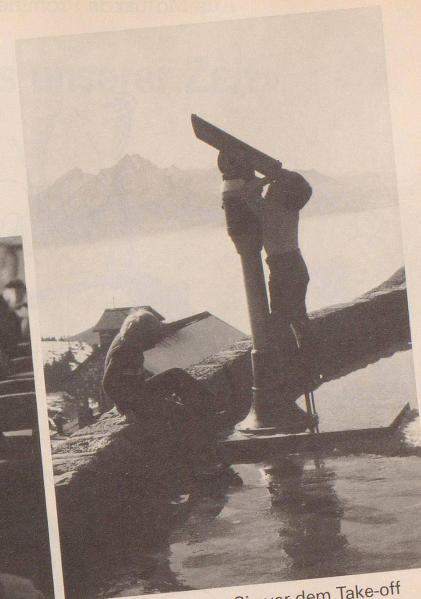
4 Und vergessen Sie vor dem Take-off nicht, Ihre Lieben zuhause über Flugplan und Route zu informieren.