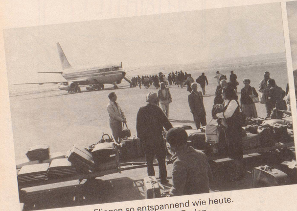
1 Noch nie war Fliegen so entspannend wie heute. Das Vergnügen beginnt bereits am Boden. Im Bild die neue Gepäckabfertigung im Flughafen Kloten.