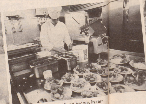
6 ...während Meister ihres Faches in der Bordküche erlesene Gaumenfreuden arrangieren.