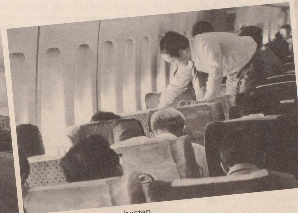
3 ... in der Ihnen am besten zusagenden Position.