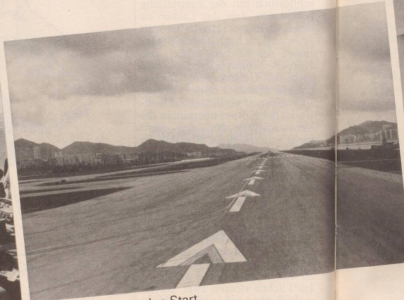
2 Geniessen Sie den Start auf jeden Fall ...