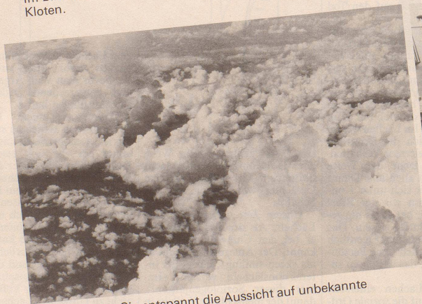
5 Geniessen Sie entspannt die Aussicht auf unbekannte Landschaften, ...