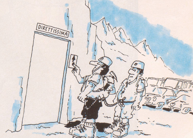
Immer noch warten einige Viertausender darauf, von unerschrockenen, aber gut ausgerüsteten Berggängern gestürmt zu werden.