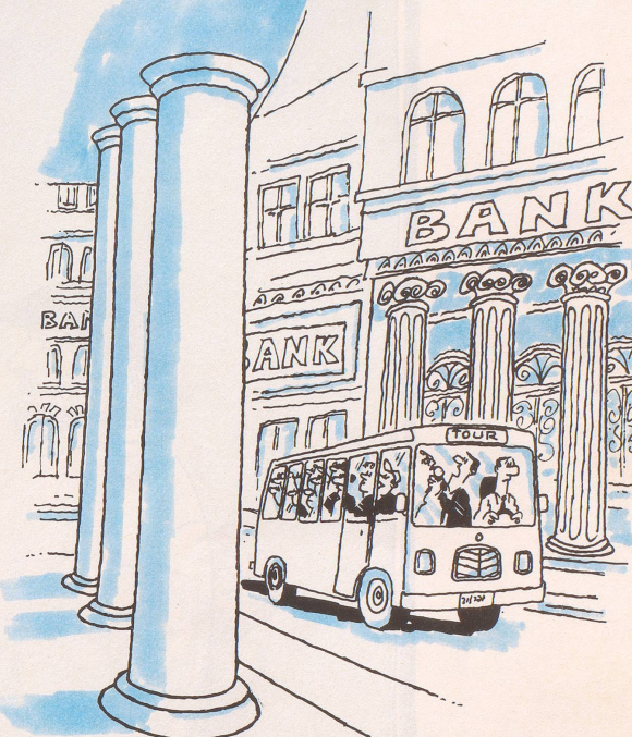
Speziell für Amerikaner: Tour durch den Schweizer Banken-Dschungel: «... und links lagern im Untergeschoss 200 Millionen Franken von Herrn Marcos, rechts, etwa zehn Meter unter Strassenniveau, werden 15 Millionen Franken Contra-Gelder vermutet, sofern sie richtig verbucht sind.»