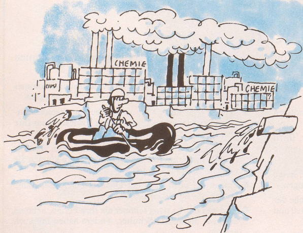
Trotz unserer gezähmten, begradigten und gestauten Flüsse sind gefährliche Wildwasserfahrten auch heute noch möglich.