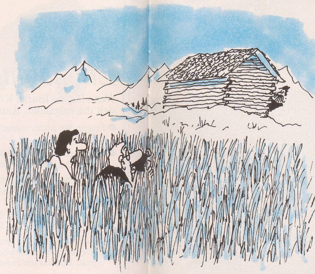
Abenteuerliche Photosafaris auf den Spuren einer fast ausgestorbenen Spezies: «Da haben wir aber wahnsinnig Glück gehabt: ein echter Bündner Bergbauer!»