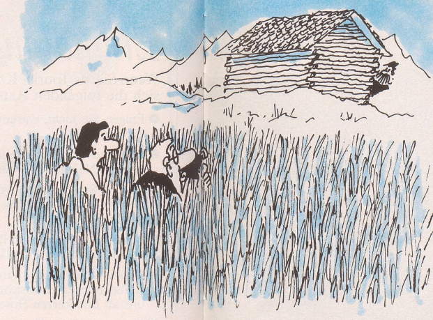
Abenteuerliche Photosafaris auf den Spuren einer fast ausgestorbenen Spezies: «Da haben wir aber wahnsinnig Glück gehabt: ein echter Bündner Bergbauer!»