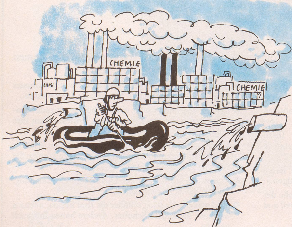
Trotz unserer gezähmten, begradigten und gestauten Flüsse sind gefährliche Wildwasserfahrten auch heute noch möglich.