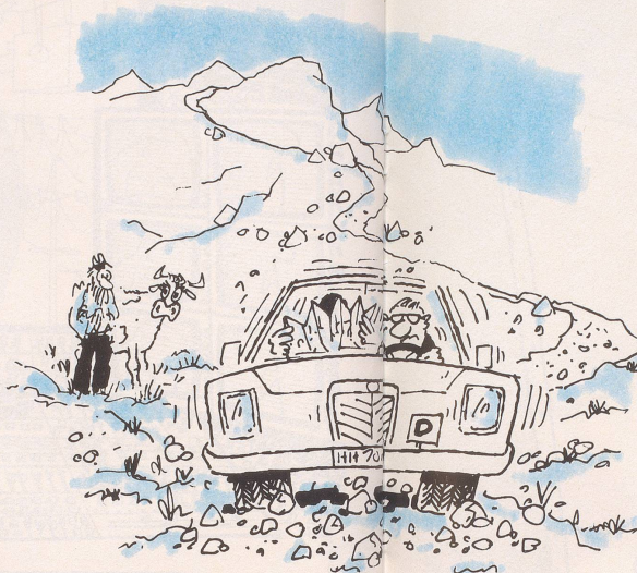
Etwas ganz Besonderes für abenteuerlustige Deutsche: die Schweizer Geröllhalden- und Bergwüsten-Rallye zwischen der deutschen und italienischen Grenze ganz ohne Autobahnvignette!