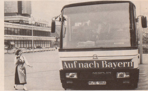
Achtung: Beharren Sie im Reisebüro auf einem China-Arrangement und fallen Sie keinesfalls auf das Werben der Schmutzkonzurrenz herein!