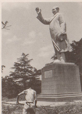
Herzlich heissen die Chinesen die fremden Gäste willkommen. Auch die westliche Kultur ...