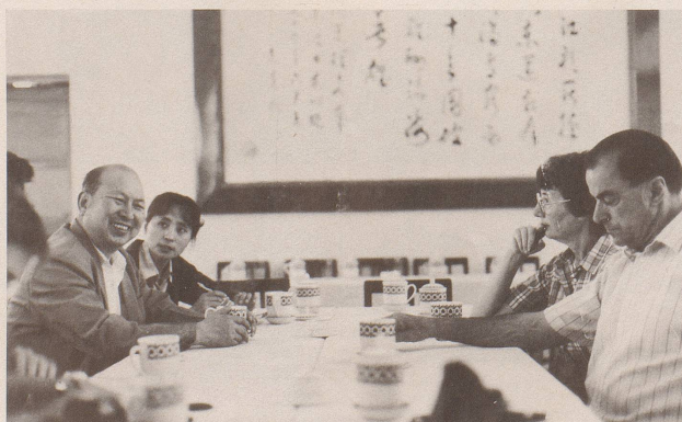
Die Einheimischen bedanken sich für das Einfühlungsvermögen mit spontanen Gesten der Freundschaft. (Bild: eine Imholz-Reisegruppe, die dem Drängen chinesischer Bauern nachgegeben hat, beim Grüntee.)