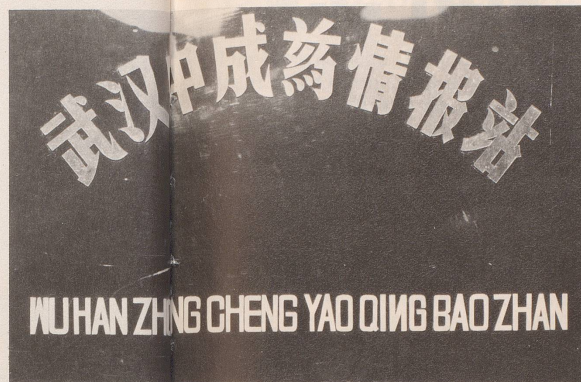
... entwickelte sich das eingängigen Werbeslogans ...