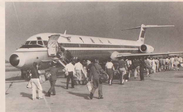
... zu einem der grössten touristischen Magnete der Erde.