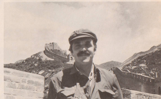
Dennoch sehen es die Chinesen gern, wenn der Gast dem Land seine Reverenz erweist. (Das Photo zeigt — etwas unscharf — einen Playboy von der Zürcher Goldküste in der chinesischen Arbeiterluft.)