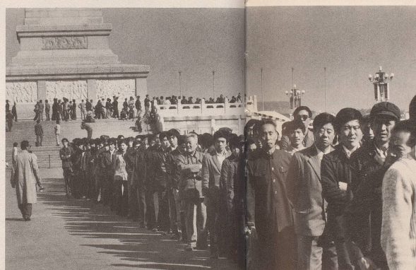
... wird freudig übernommen. (Bild: Kunden vor dem ersten McDonald's-Restaurant in Peking.)