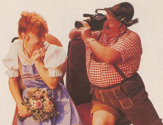
Ein Tag, an dem man plötzlich zum Filmstar wird.