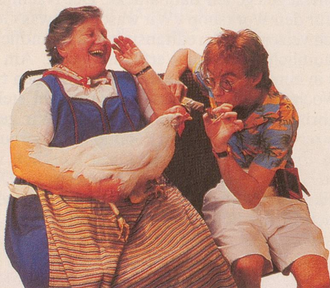
Ein Tag, an dem die ländliche Natur greifbar ist.