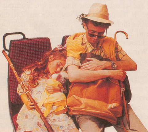
Ein Tag, an dem man wie im Traum nach Hause kommt.

Mit der 7-Tage-Karte können Sie während sieben aufeinanderfolgenden Tagen unbeschränkt Postautofahren.