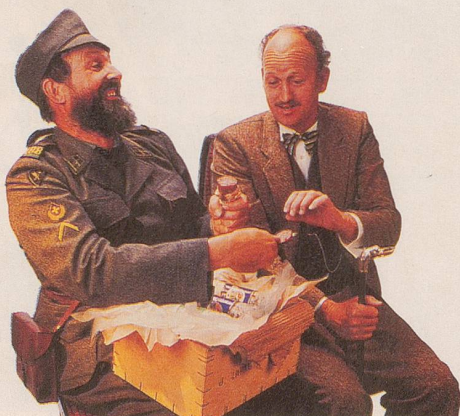
Ein Tag, an dem die Verpflegung gewährleistet ist.