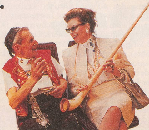
Ein Tag, an dem Swiss Music die ganze Welt begeistert.