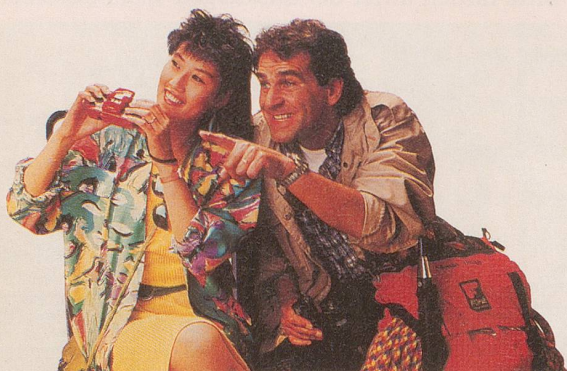
Ein Tag, an dem alle Alpengipfel «Fujijama» heissen.