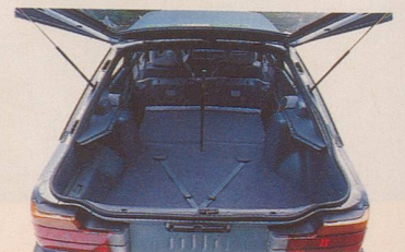
Ein Kofferraum wie eine kleine Turnhalle.

Der neue Mazda 626 haut einen wirklich aus den Schuhen.