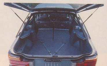
Ein Kofferraum wie eine kleine Turnhalle.

Der neue Mazda 626 haut einen wirklich aus den Schuhen.