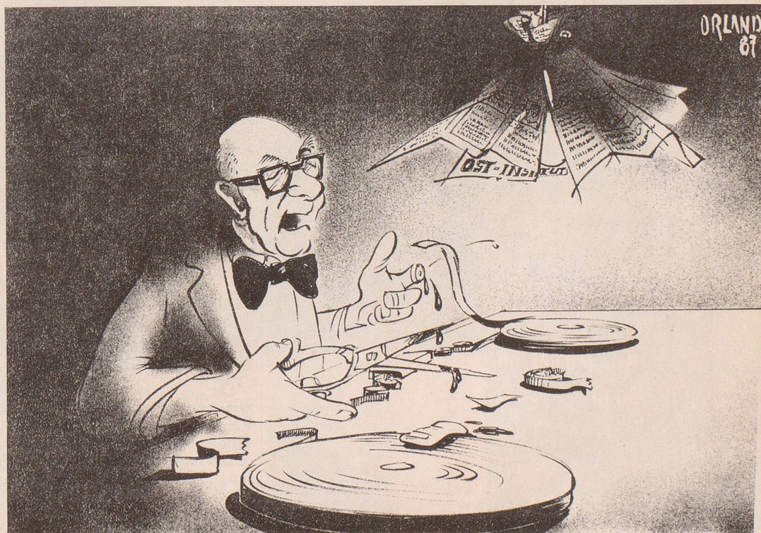
Ins eigene Fleisch geschnitten ... Sagen- oder sagerhafte Medienanalyse?