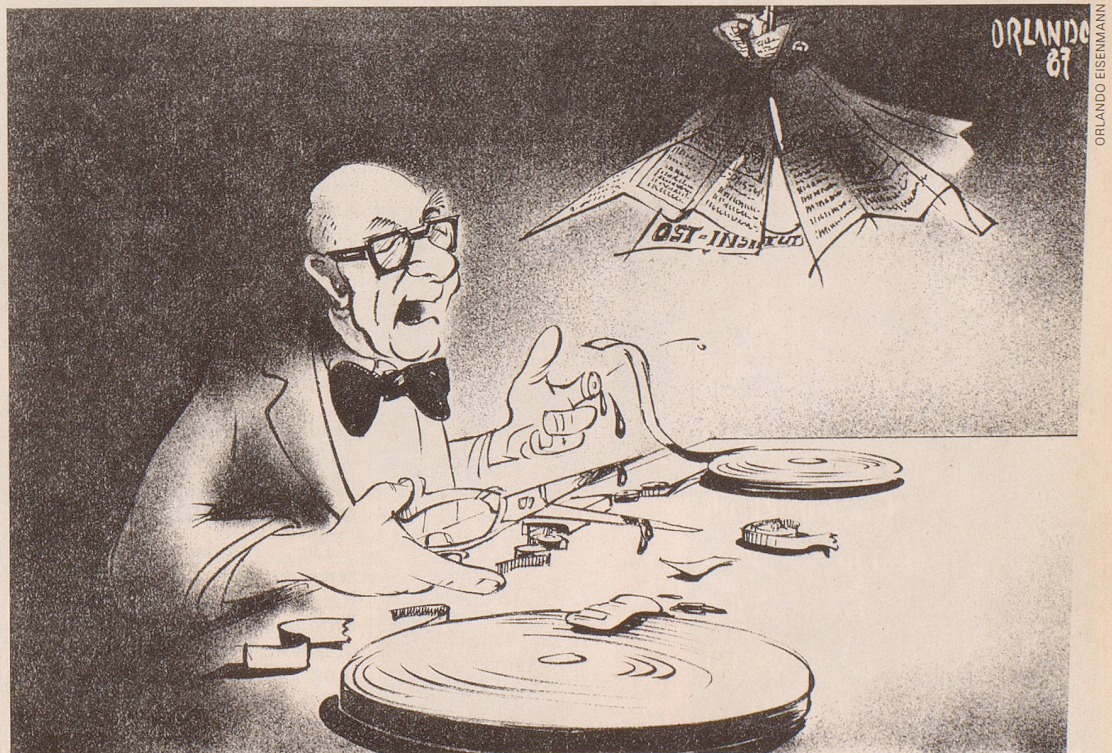
Ins eigene Fleisch geschnitten ... Sagen- oder sagerhafte Medienanalyse?