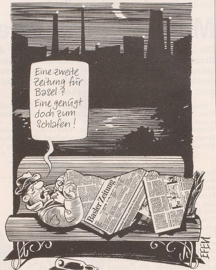
Lanciert das Haus Ringier in Basel eine zweite grosse Tageszeitung? Der Entscheid dazu soll im Lauf des Sommers fallen.