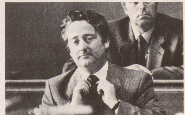
... oder auch vor dem Gesetz.