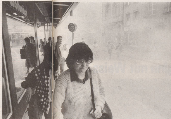
... Tränen kommen einem beim Einkaufen nur der hohen Preise wegen ...