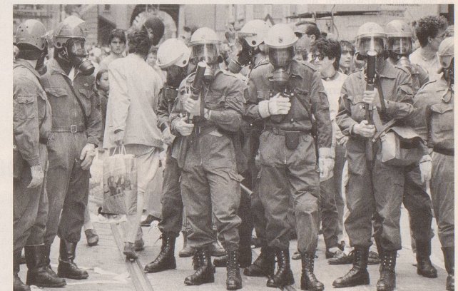
... und ausserdem: Gelegentlich haben auch zufällige Passanten Überlebenschancen.