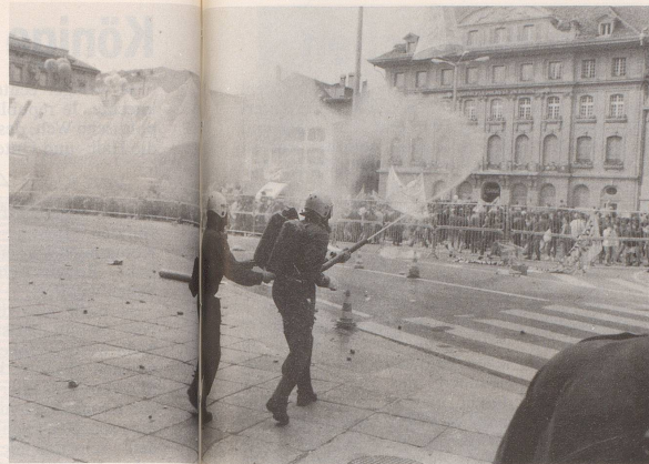
... auf besonders originelle Art und Weise gelöst ...