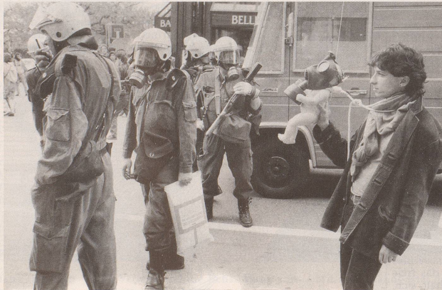
Trotzdem: Der Einsatzleiter war nicht der zweite von rechts ...