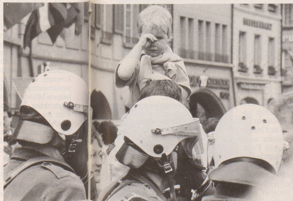
... ob nur vor der Polizei alle Schweizer gleich sind ...