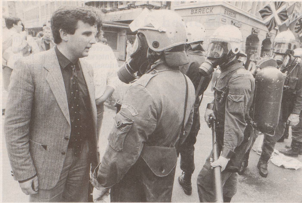
Meinungsverschiedenheiten werden in Bern ...

Dokumentiert von den beiden Bernern Michael von Graffenried und Ueli Schmezer am Beispiel der Berner Tschernobyl-Demonstration.