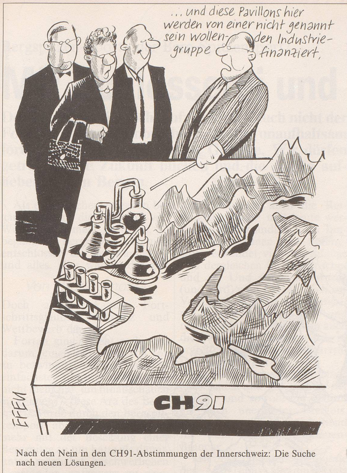
Nach den Nein in den CH91-Abstimmungen der Innerschweiz: Die Suche nach neuen Lösungen.