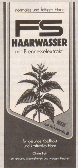
für normales und fettiges Haar.

Beide Sorten gibt es auch für blondes, braunes und schwarzes Haar.