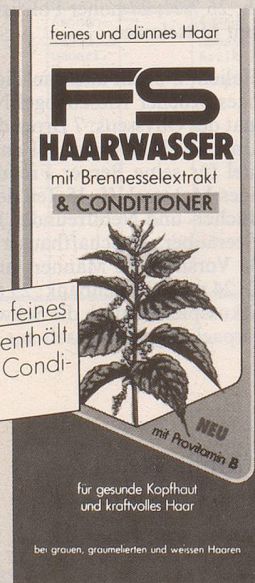
für feines und dünnes Haar.

NEU: FS Haarwasser für feines und dünnes Haar enthält zusätzlich einen haarpflegenden Conditioner für mehr Halt und Fülle.