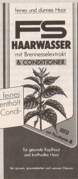
für feines und dünnes Haar.

NEU: FS Haarwasser für feines und dünnes Haar enthält zusätzlich einen haarpflegenden Conditioner für mehr Halt und Fülle.