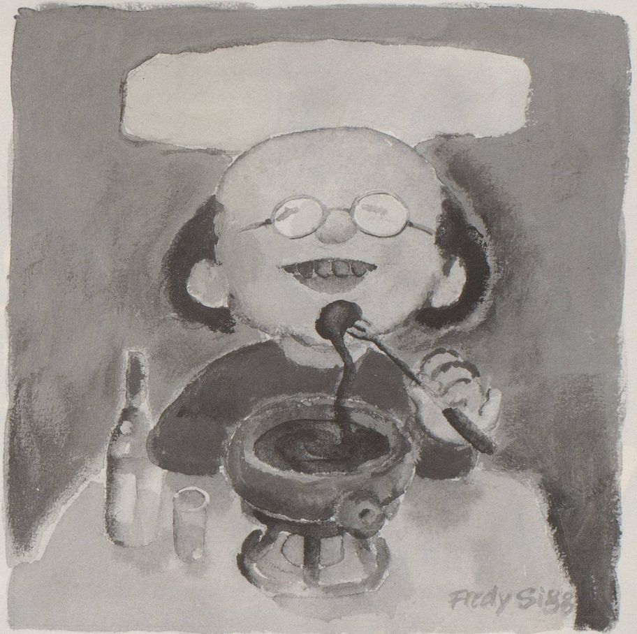
Walliser Spezialität der Saison: Skiwachsfondue à la mode de Zurbriggen

Welche Vorstellungen würden Sie spontan äussern, wenn Sie mit dem Stichwort «Wallis» konfrontiert wären? Wir brauchen uns da gar nicht in Mutmassungen zu ergehen: Wahrscheinlich kämen immer wieder Klischeevorstellungen zum Vorschein. Für viele Deutschschweizer sind die Walliser immer noch jener Schlag von Leuten, die Tomaten in die Rhone schmeissen, sich den Weinbau vom Bund subventionieren lassen, wunderschöne Berglandschaften mit Hochhäusern verbauen oder wegen Skipisten zu Steinwüsten planieren ... Dass all das wirklich passiert ist, streitet auch im Wallis niemand ab, obwohl man die gleichen Sachverhalte dort natürlich aus einer anderen Optik sieht. Seit kurzer Zeit bemüht sich der Kanton bewusst und aktiv um ein anderes Image. Wie weit sich dies ändern kann, hängt davon ab, was man in der «Üsserschwyz» alles über diesen Kanton und seine Bewohner erfährt.