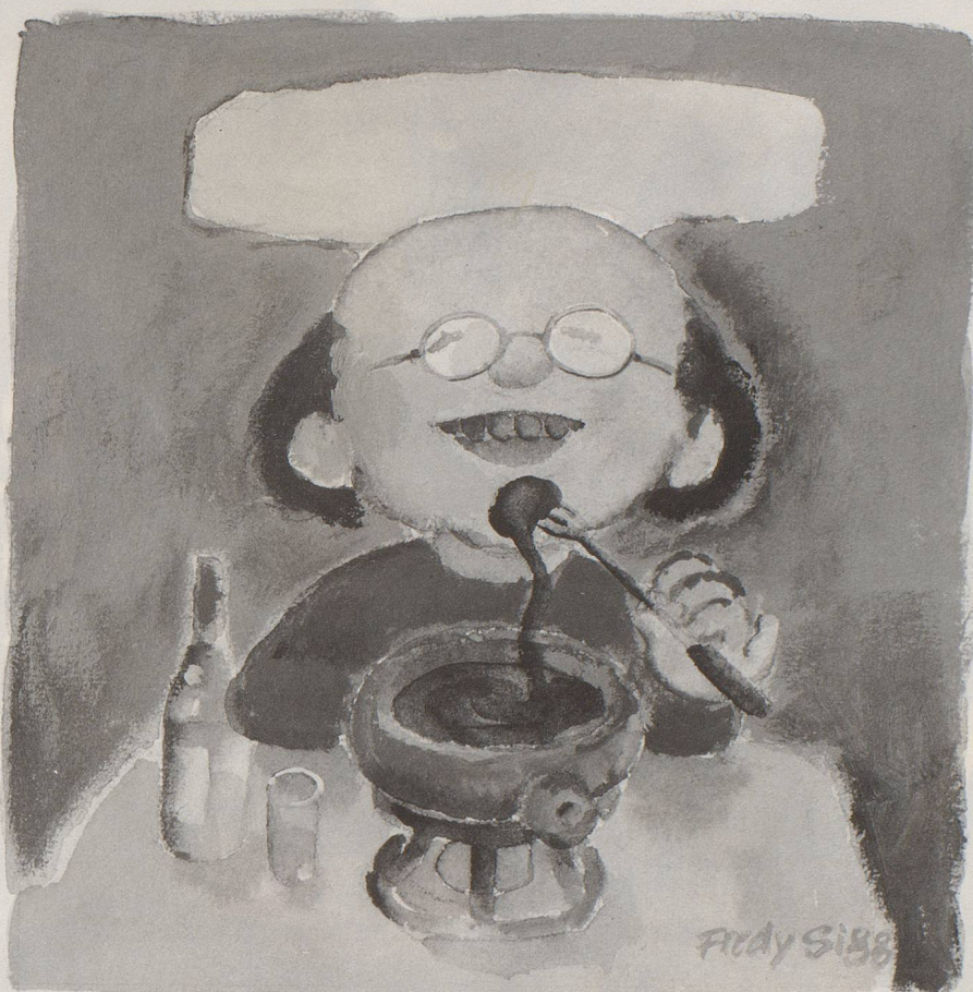
Walliser Spezialität der Saison: Skiwachsfondue à la mode de Zurbriggen