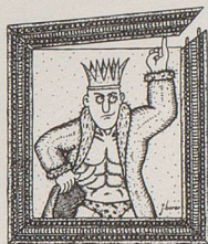
Max der Starke