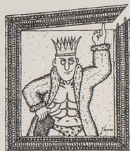
Max der Starke