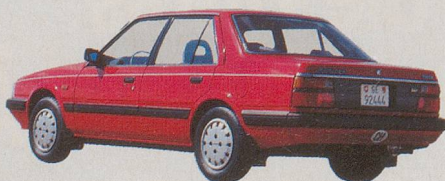
Den Mazda 626 gibt's in zwei Versionen: 5-türig wie im grossen Bild und 4-türig wie im kleinen.