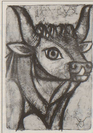
z. B. Stier (21.4.–20.5)

Jedes Sujet in limitierter Auflage von 150 Blättern. Jedes Blatt vom Künstler handsigniert und numeriert. Büttenpapier, Format 65 x 50 cm, je Fr. 480.–