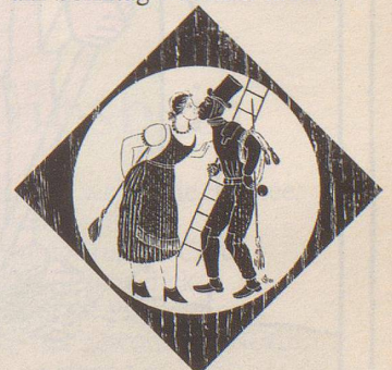
Kartensujet des Schweiz. Kaminfegermeister-Verbandes

Alles mögliche soll im Zusammenhang mit dem Chämifäger Glück bringen. Glücksgipfel: Man begegnet am Morgen (es ist