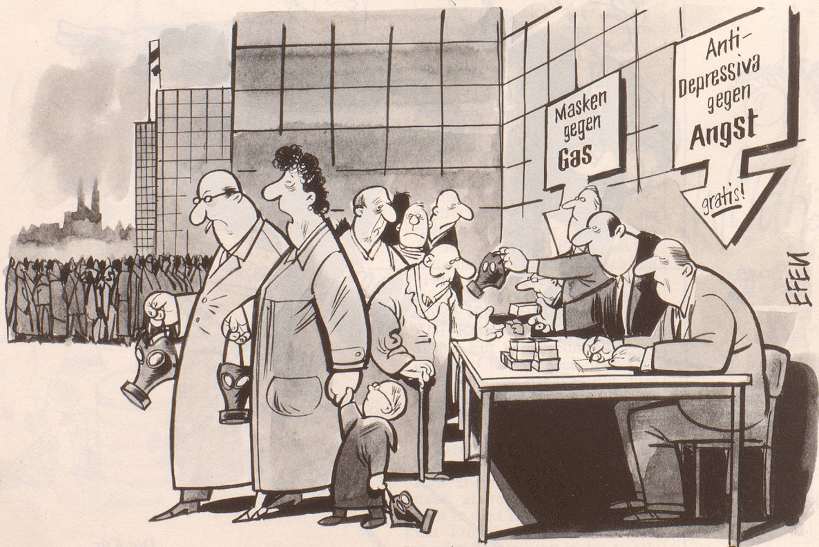
«Sie haben ja gesagt, sie würden alles im Bereiche ihrer Möglichkeiten tun ...»