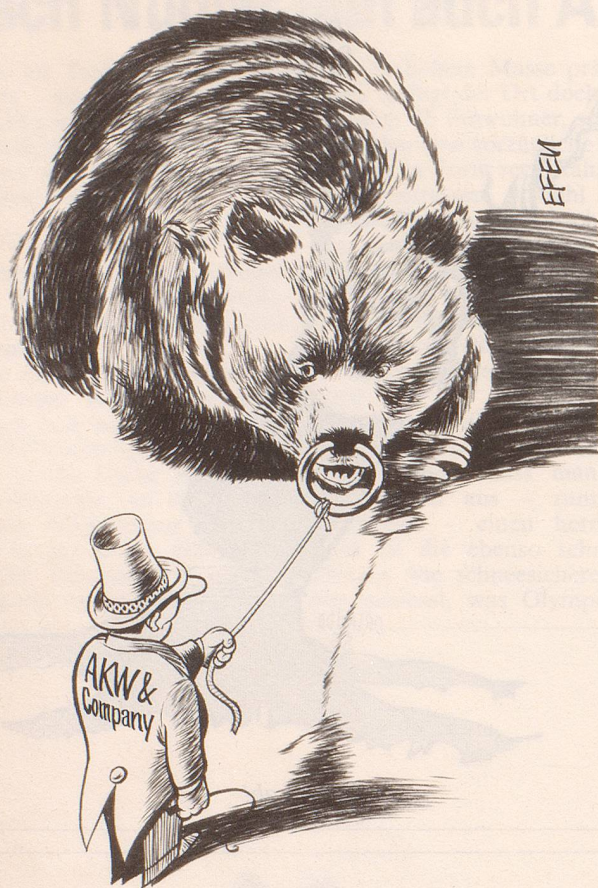
Nach dem Entscheid des Berner Grossen Rates zum Ausstieg aus der Kernenergie: Der Bär will nicht mehr tanzen.