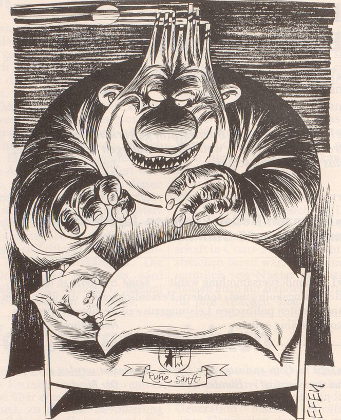
Nach dem Entscheid des Berner Grossen Rates zum Ausstieg aus der Kernenergie: Der Bär will nicht mehr tanzen.