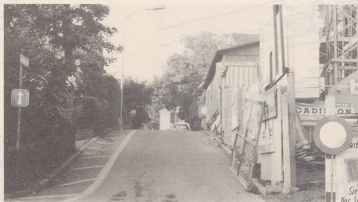
Eine Übungsstrecke für Geisterfahrer?