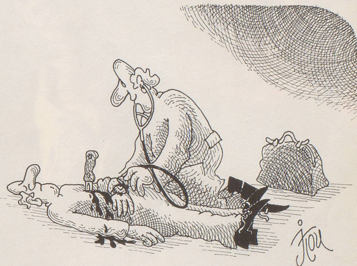
Bilder: JORDAN POP-ILIEV