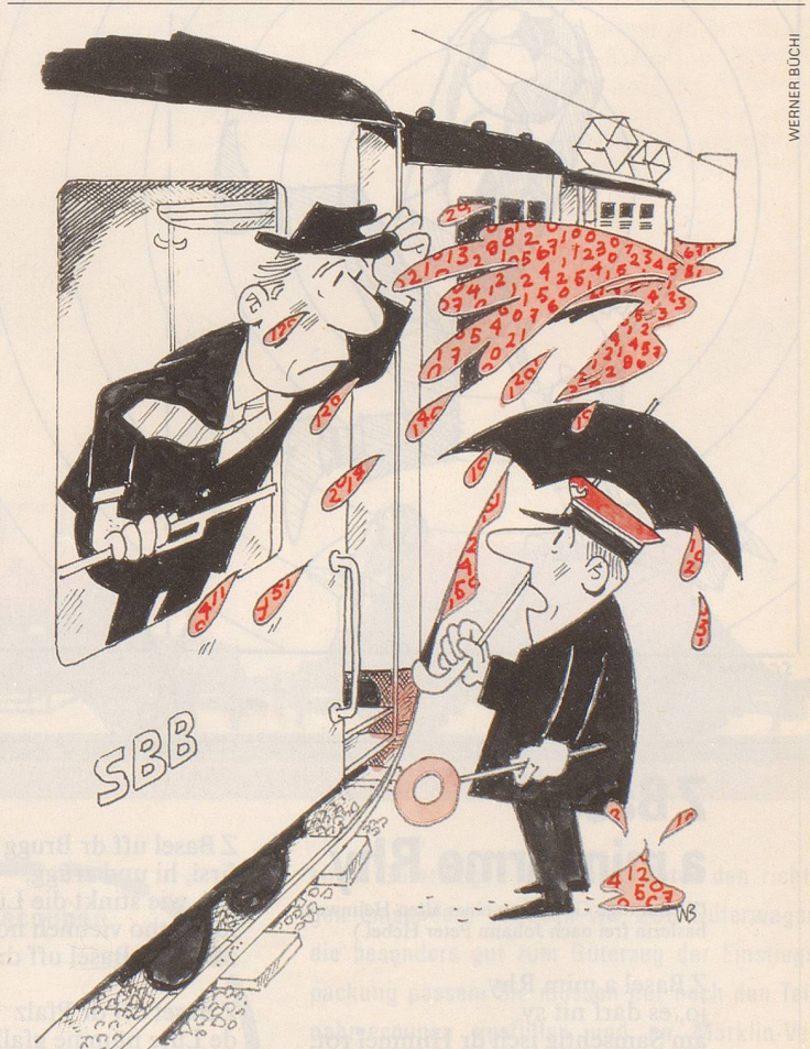
1986 werden die SBB ein höheres Defizit erreichen als im Budget erwartet. Für 1987 sieht die Situation in dieser Hinsicht noch schlechter aus.

SBB fahren tiefer in die roten Zahlen «Kei Angscht, sisch nüt Chemisches, es sind nur öisi rote Zahle!»