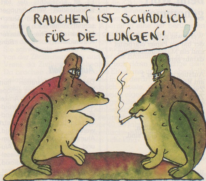
Amphibische Gedanken von Rapallo

Seufzt der Vater: «Seit ich meinen Kindern ein Vorbild sein möchte, stelle ich fest, dass ich nichts mehr vom Leben habe.»