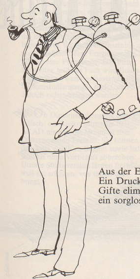
Aus der Erfindermesse: Ein Druckfilter, der sämtliche Gifte eliminiert, garantiert ein sorgloses Rauchen.