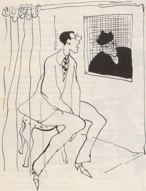
«Pater, ich habe letzte Woche drei Zigaretten geraucht.»