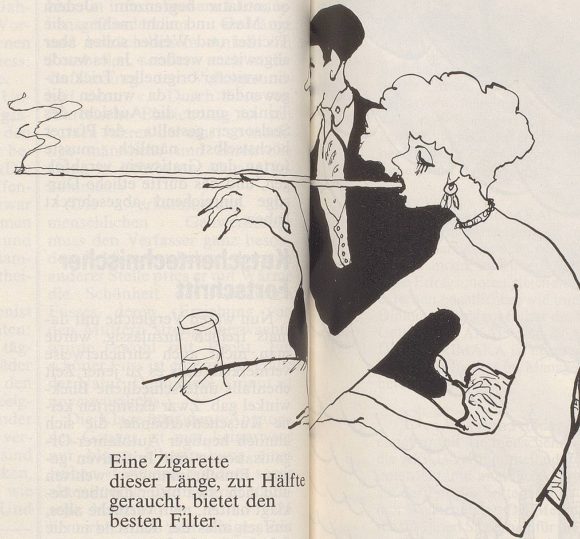
Eine Zigarette dieser Länge, zur Hälfte geraucht, bietet den besten Filter.

Fredy Sigg (selbst Brissagoraucher) zeichnet nach, wie hart die Zeiten für jene geworden sind, die dem Laster und dem Genuss des blauen Dunstes frönen.