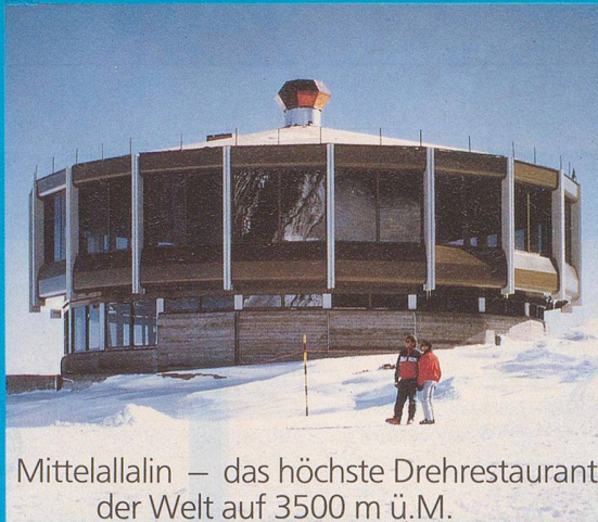
Mittelallalin — das höchste Drehrestaurant der Welt auf 3500 m ü.M.