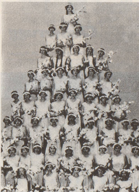
Im Sommer 1930 veranstaltete der Männerchor Frohsinn ein Sängerverfest in Zürich. Unter dem Motto «Der Segen der Arbeit» wurden unter charmanter Assistenz hübscher Zürcherinnen lebendige Bilder präsentiert: Lob des Frühlings, Rosenzeit, Ernte und Dankopfer. Besonders eindrucksvoll wirkte dieser graziöse Damenturm zur Darstellung der «Rosenzeit». Ob die Spitze der holden Frauennyramide wohl von einer Rosa gebildet wurde?