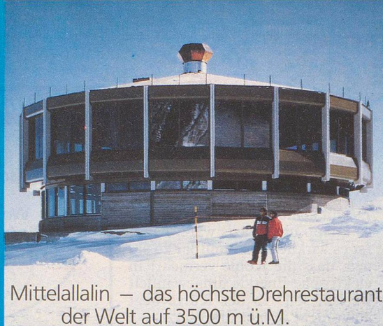
Mittelallalin — das höchste Drehrestaurant der Welt auf 3500 m ü.M.