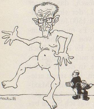
«Nattango»: KPI-Sekretär Natta tanzt zur Musik von Craxi und Andreotti.

dann muss sich der mitteleuropäische Mensch gleich fragen: «So schreiben sie, aber was meinen sie wirklich?» Ganz schlimm ist es geworden, seit die Unità sich mit einer so doppelbödigen Materie wie dem Humor abgibt. Mir ist bis heute nicht aufgegangen, warum sich solche Fanatiker, die ebenso viele Einwände gegen