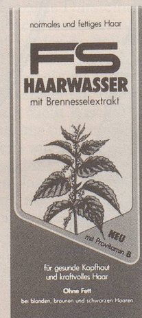
für normales und fettiges Haar

FS – das Haarwasser mit Brennesselextrakt.