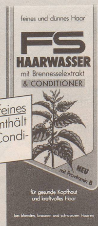
für feines und dünnes Haar

NEU: FS Haarwasser für feines und dünnes Haar enthält zusätzlich einen haarpflegenden Conditioner für mehr Halt und Fülle.