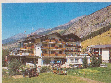
***HOTEL Touring HALLENBAD

Information: Hotel Alpha Fam. Gottlieb Bumann 3901 Saas-Grund Telefon 028/57 20 06