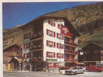
★★ Hotel Restaurant Roby

Unser Ziel: Zufriedene Gäste Familie Jules Bumann-Zurbriggen CH-3901 Saas-Grund Tel. 028/57 21 27 Telex 38669 CH HOTOU