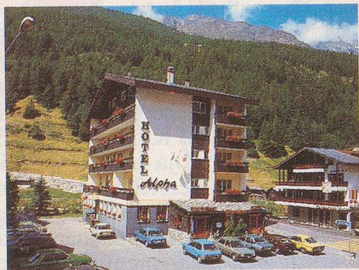
Das gepflegte Haus mit persönlicher Note ist zentral gelegen, 250 m von den Bergbahnen entfernt. Alle Zimmer mit Bad/Dusche, WC und Balkon.

Gepflegtes Haus mit familiärer Atmosphäre. Komfort — Ruhe — Erholung. Alle Zimmer mit Bad/Dusche, WC, Telefon, Balkon. Gemütliches Restaurant. Jägerstübli im Walliser Stil. Aufenthaltsraum. Sonnenterrasse. Lift. Parkplatz.