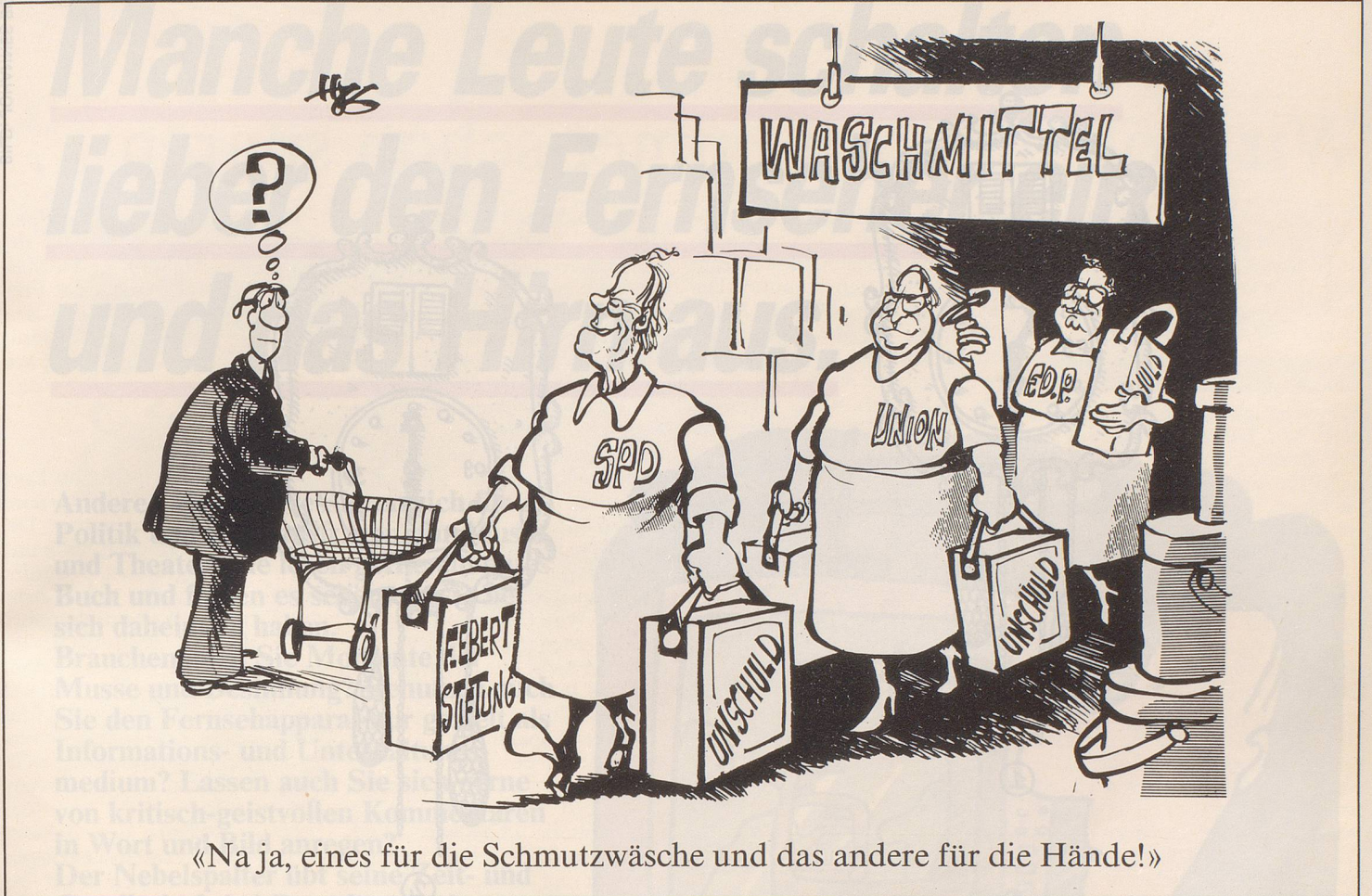
«Na ja, eines für die Schmutzwäsche und das andere für die Hände!»