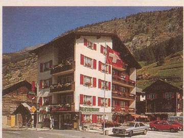
★★ Hotel Restaurant Roby

Unser Ziel: Zufriedene Gäste Familie Jules Bumann-Zurbriggen CH-3901 Saas-Grund Tel. 028/57 21 27 Telex 38669 CH HOTOU