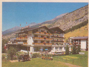
HOTEL *** Touring HALLENBAD

Information: Hotel Alpha Fam. Gottlieb Bumann 3901 Saas-Grund Telefon 028/57 20 06