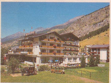
***HOTEL Couring HALLENBAD