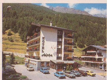
Das gepflegte Haus mit persönlicher Note ist zentral gelegen, 250 m von den Bergbahnen entfernt. Alle Zimmer mit Bad/Dusche, WC und Balkon.

Gepflegtes Haus mit familiärer Atmosphäre. Komfort – Ruhe – Erholung. Alle Zimmer mit Bad/Dusche, WC, Telefon, Balkon. Gemütliches Restaurant. Jägerstübli im Walliser Stil. Aufenthaltsraum. Sonnenterrasse. Lift. Parkplatz.