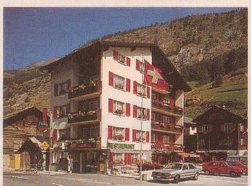
** Hotel Restaurant Roby

Unser Ziel: Zufriedene Gäste Familie Jules Bumann-Zurbriggen CH-3901 Saas-Grund Tel. 028/57 21 27 Telex 38669 CH HOTOU